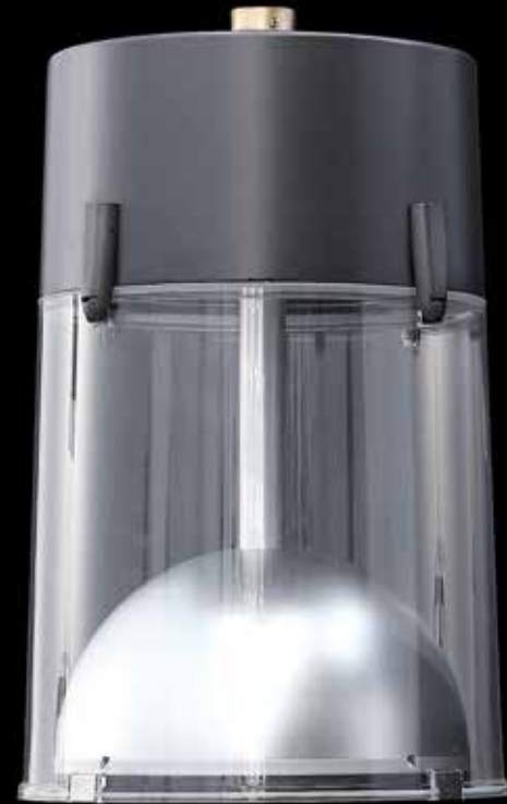
Chara | Lighting system