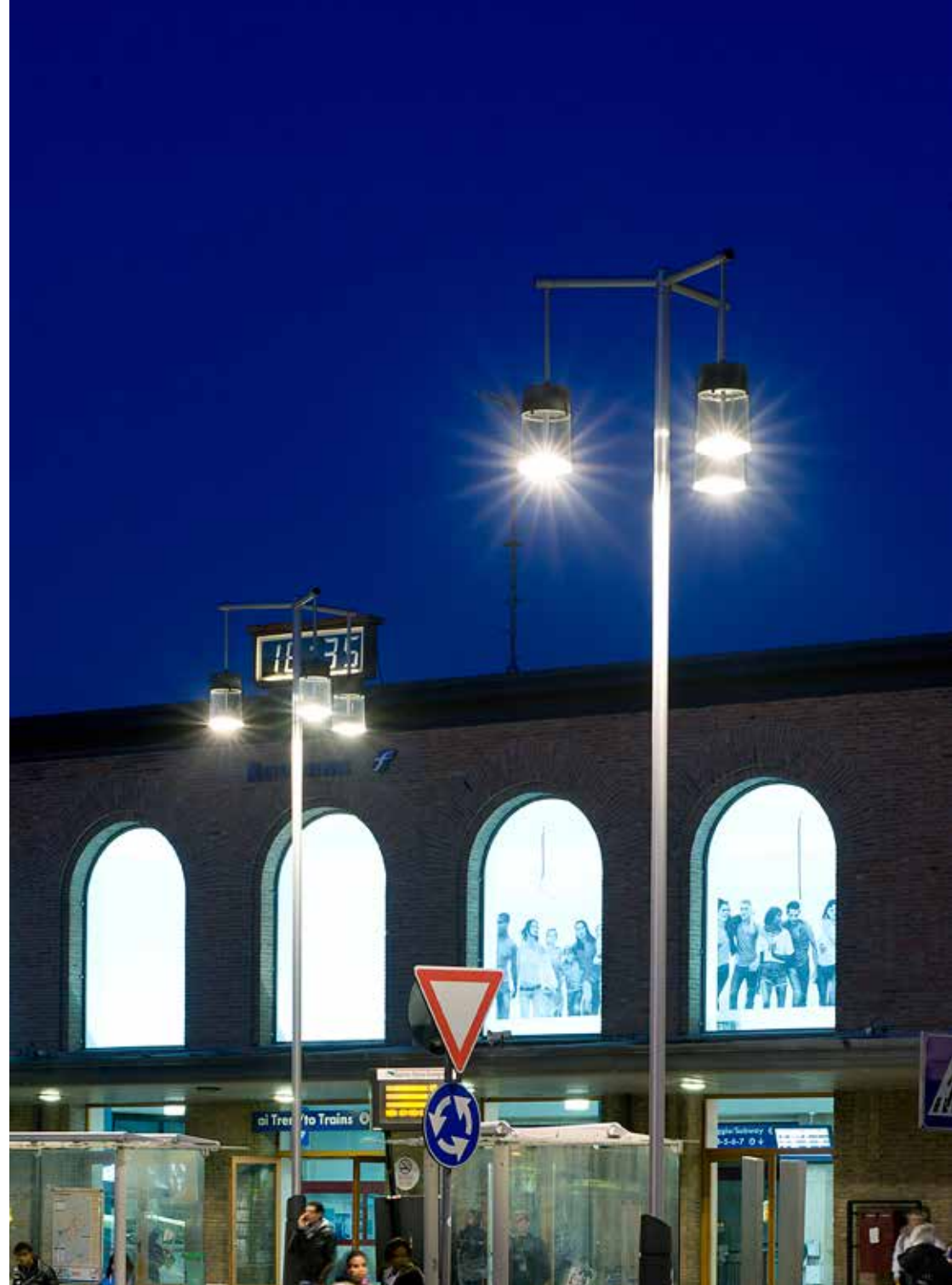
Chara | Lighting system