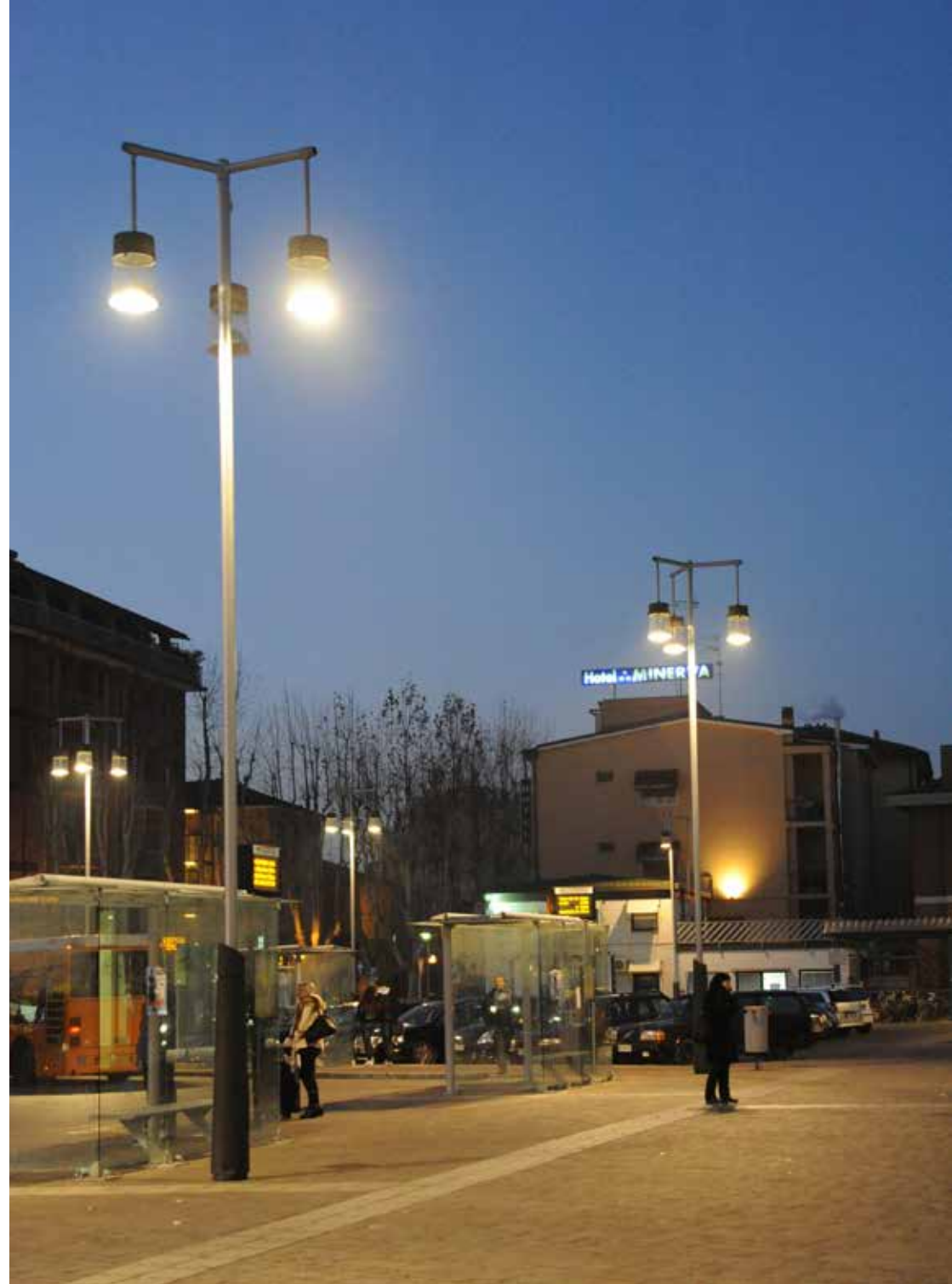
Chara | Lighting system