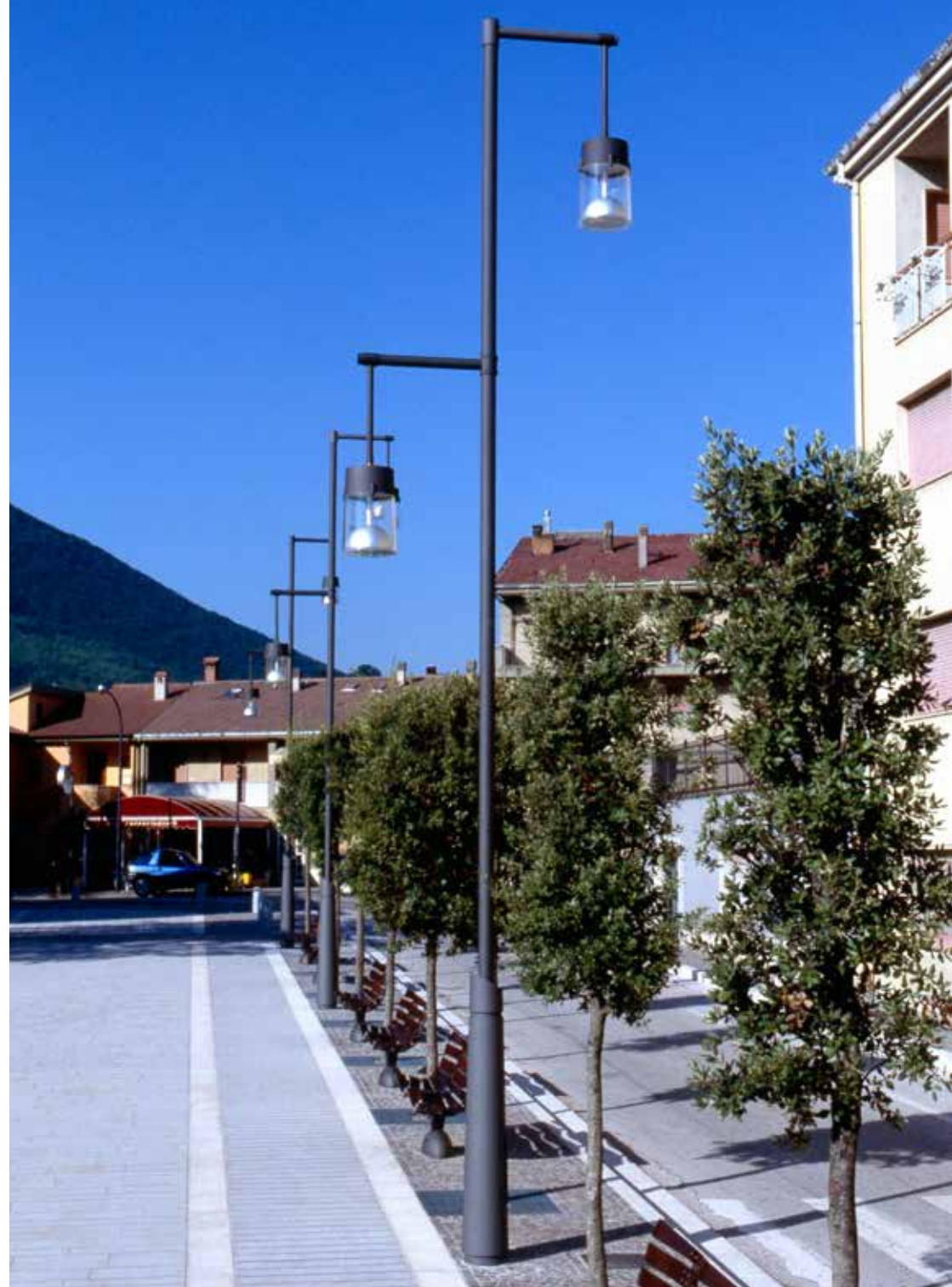
Chara | Lighting system