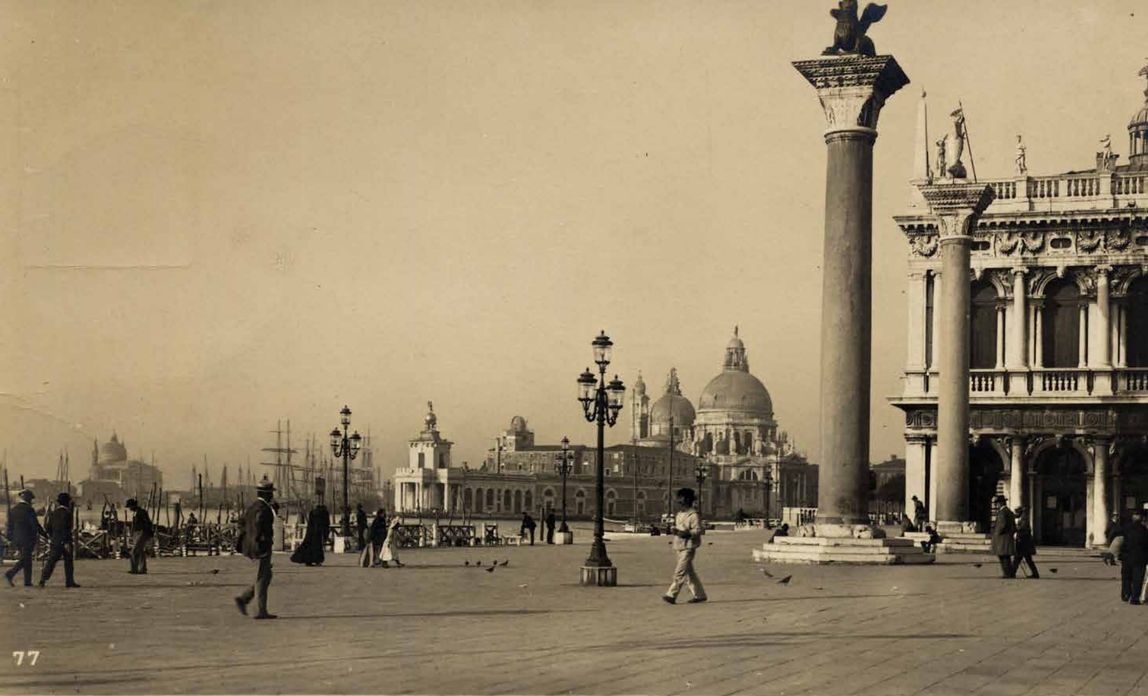
77 VENEZIA. Molo e chiesa della Salute