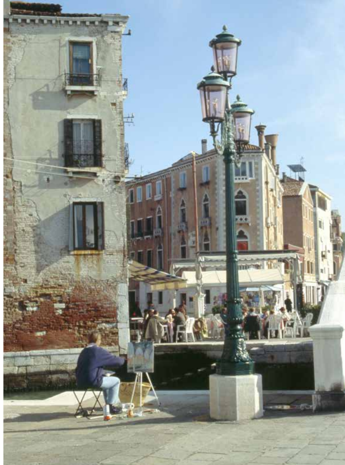
Venice (Italy) | Restoration and reproduction | Restoration