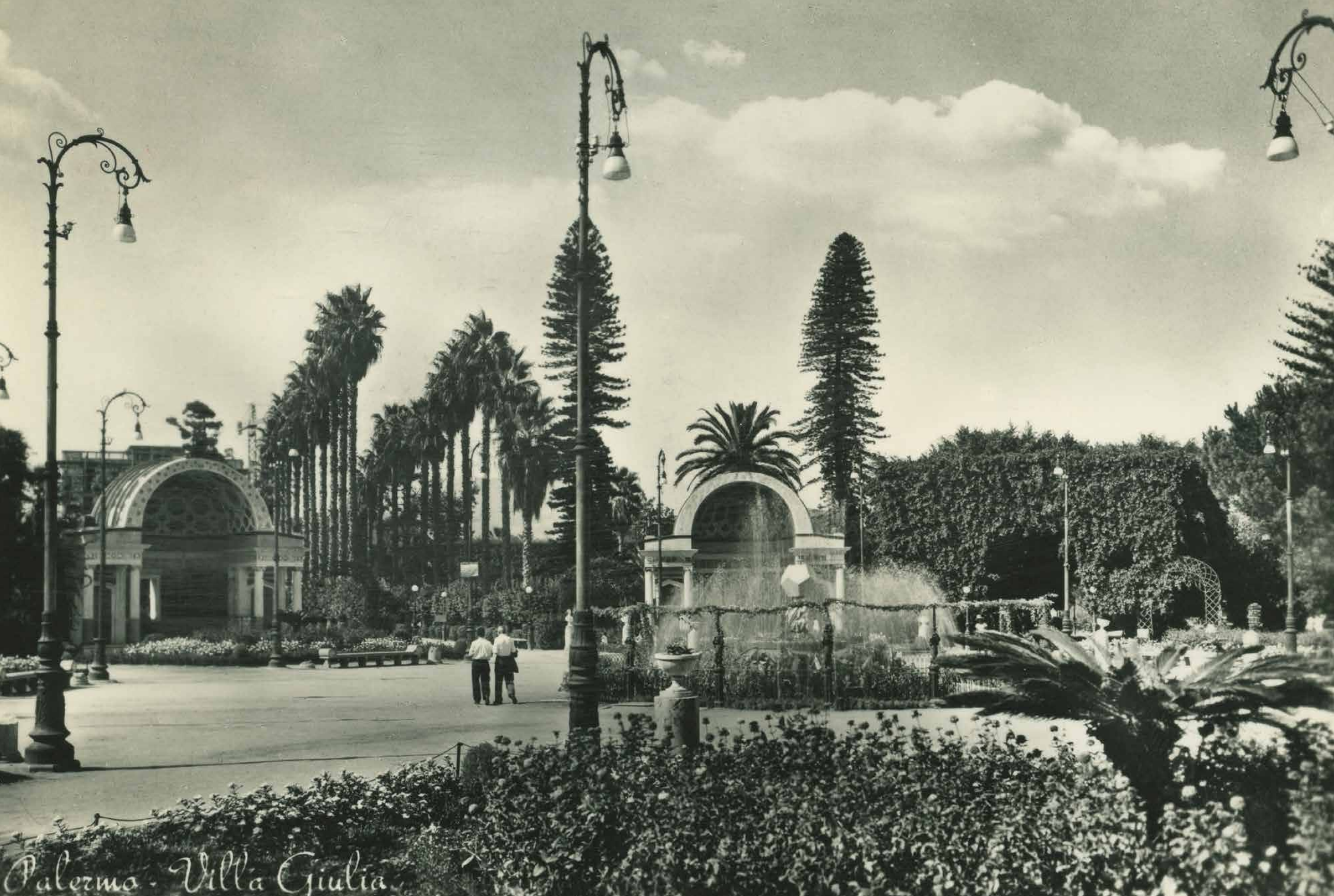
Palermo - Villa Giulia