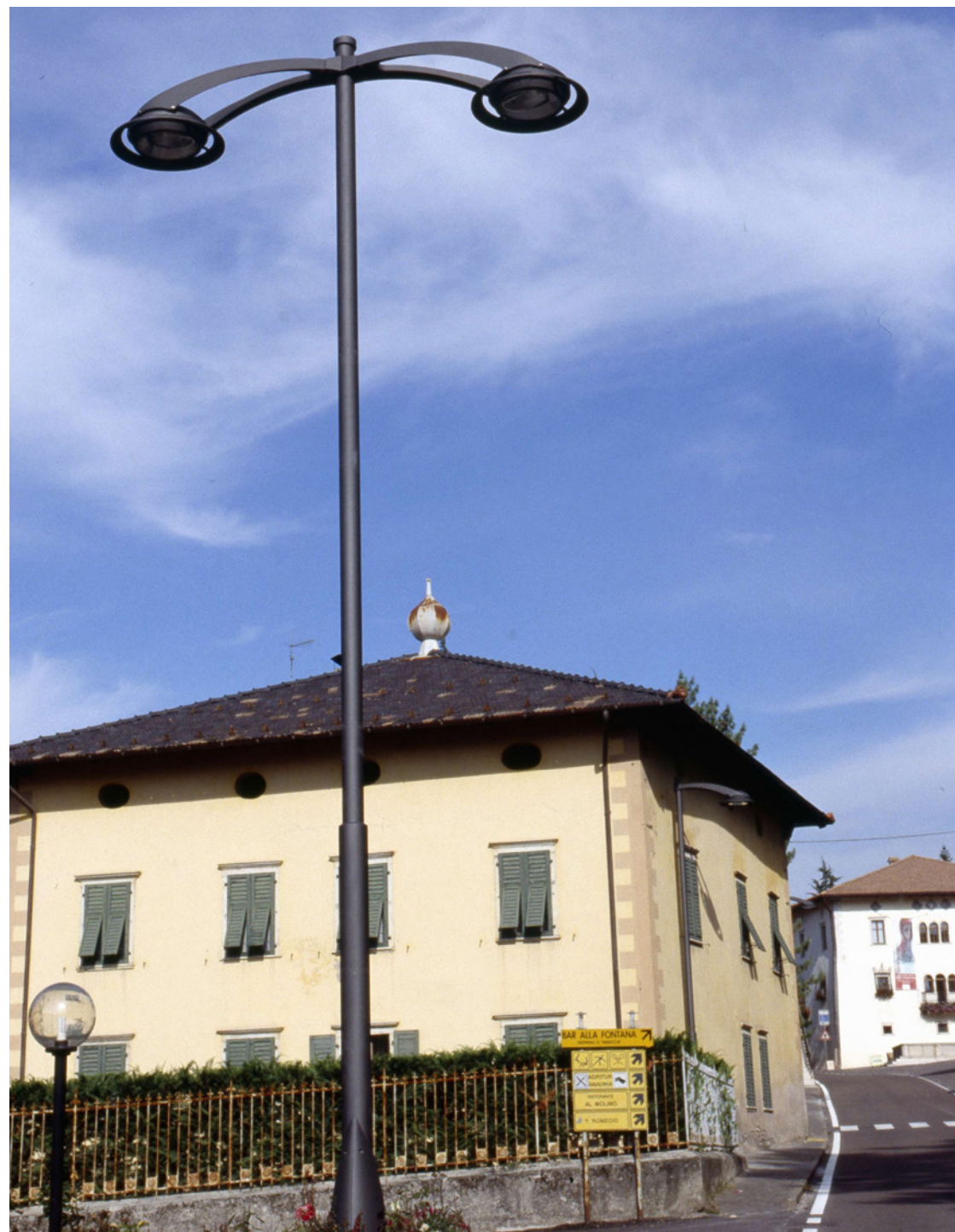
Saiph system | Lighting