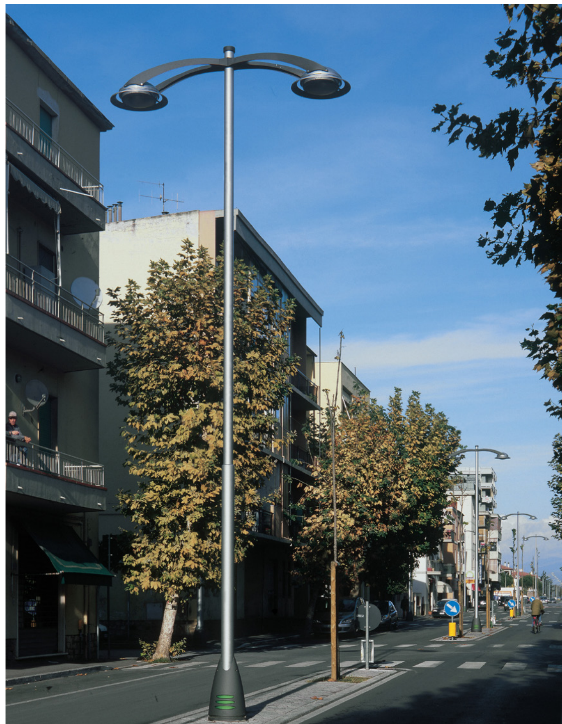
Saiph system | Lighting