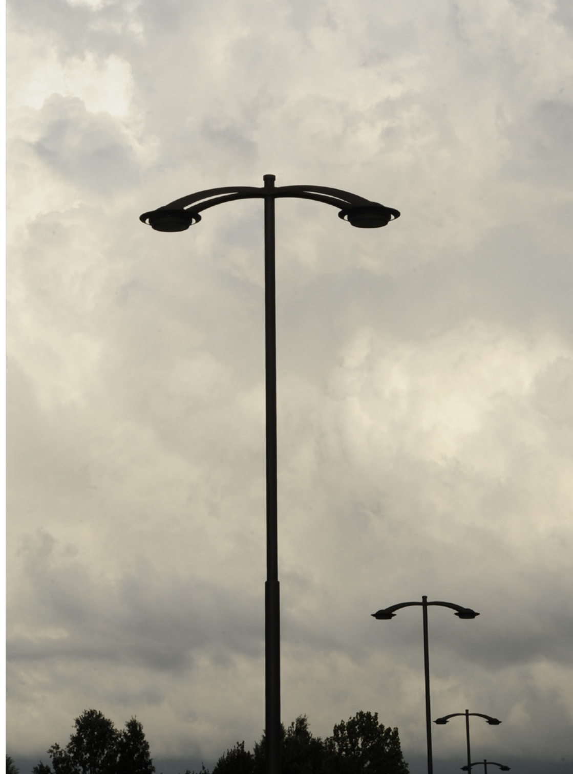
Saiph system | Lighting