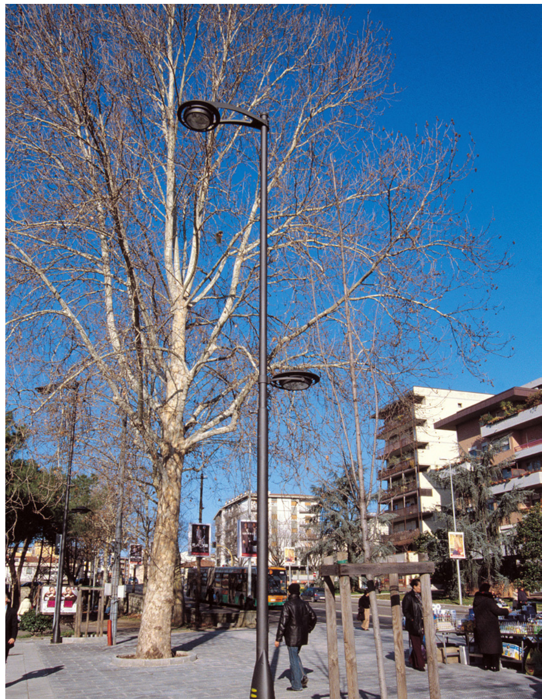
Saiph system | Lighting