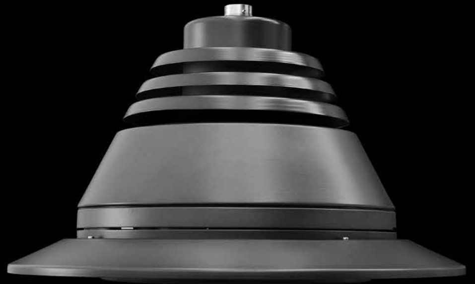
Rigel | Lighting system