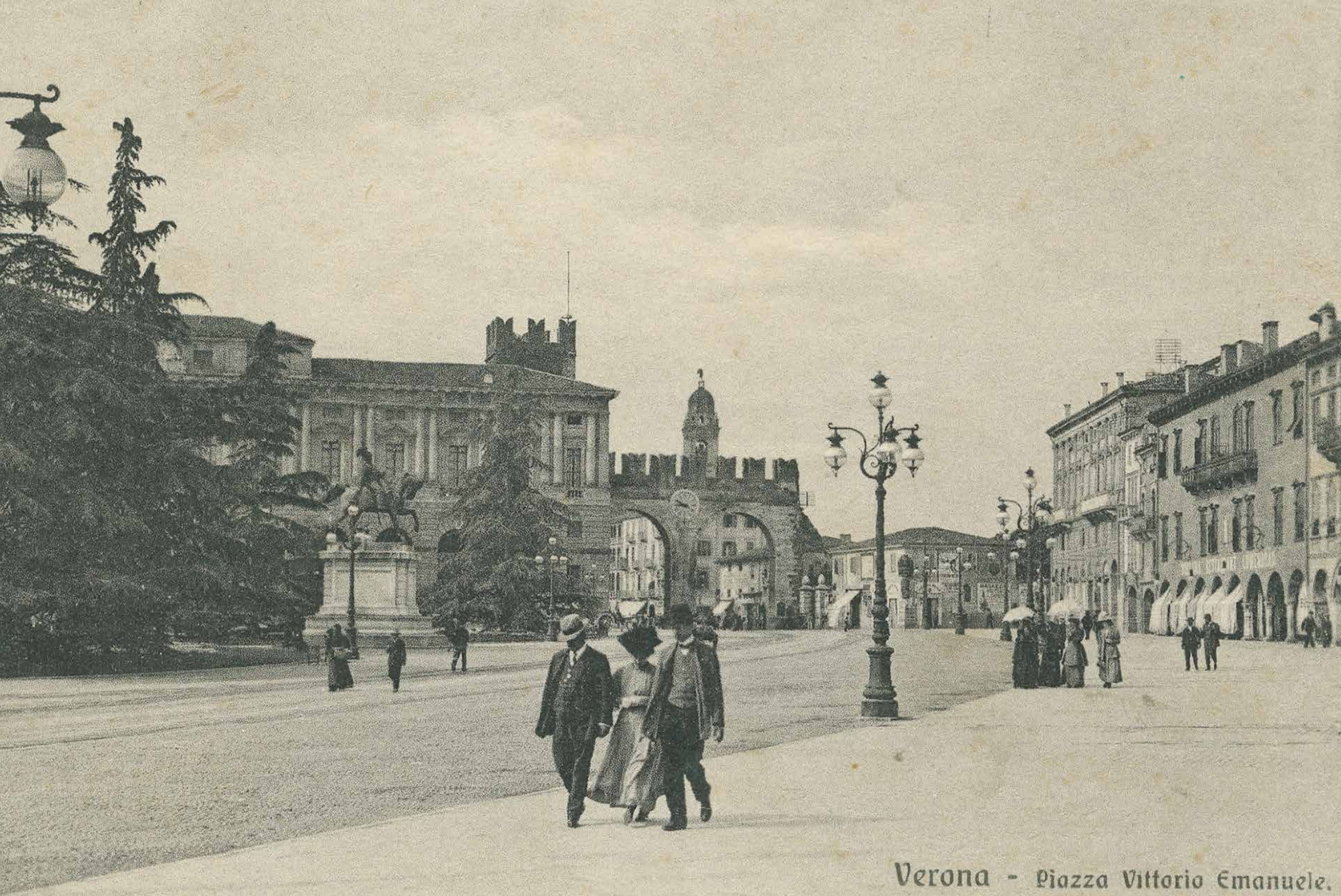
Verona - Piazza Vittorio Emanuele.