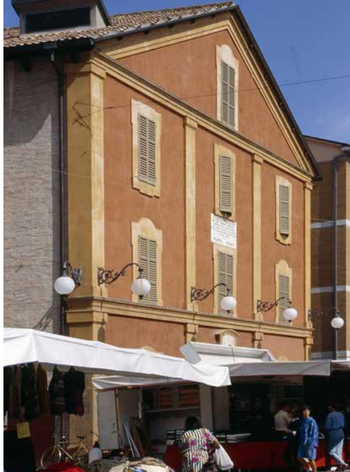
Neri and theatres | Lighting