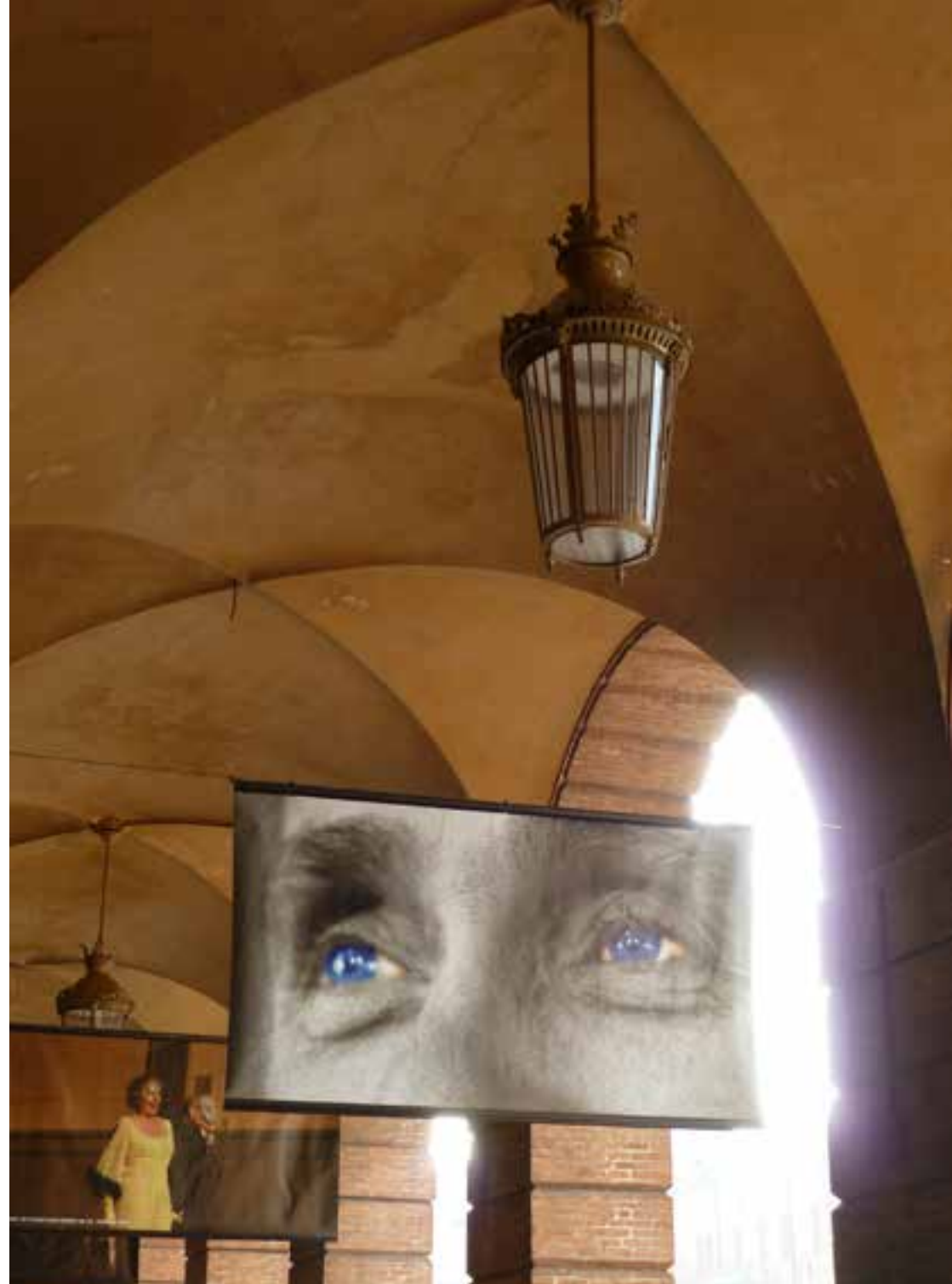
Neri and theatres | Lighting