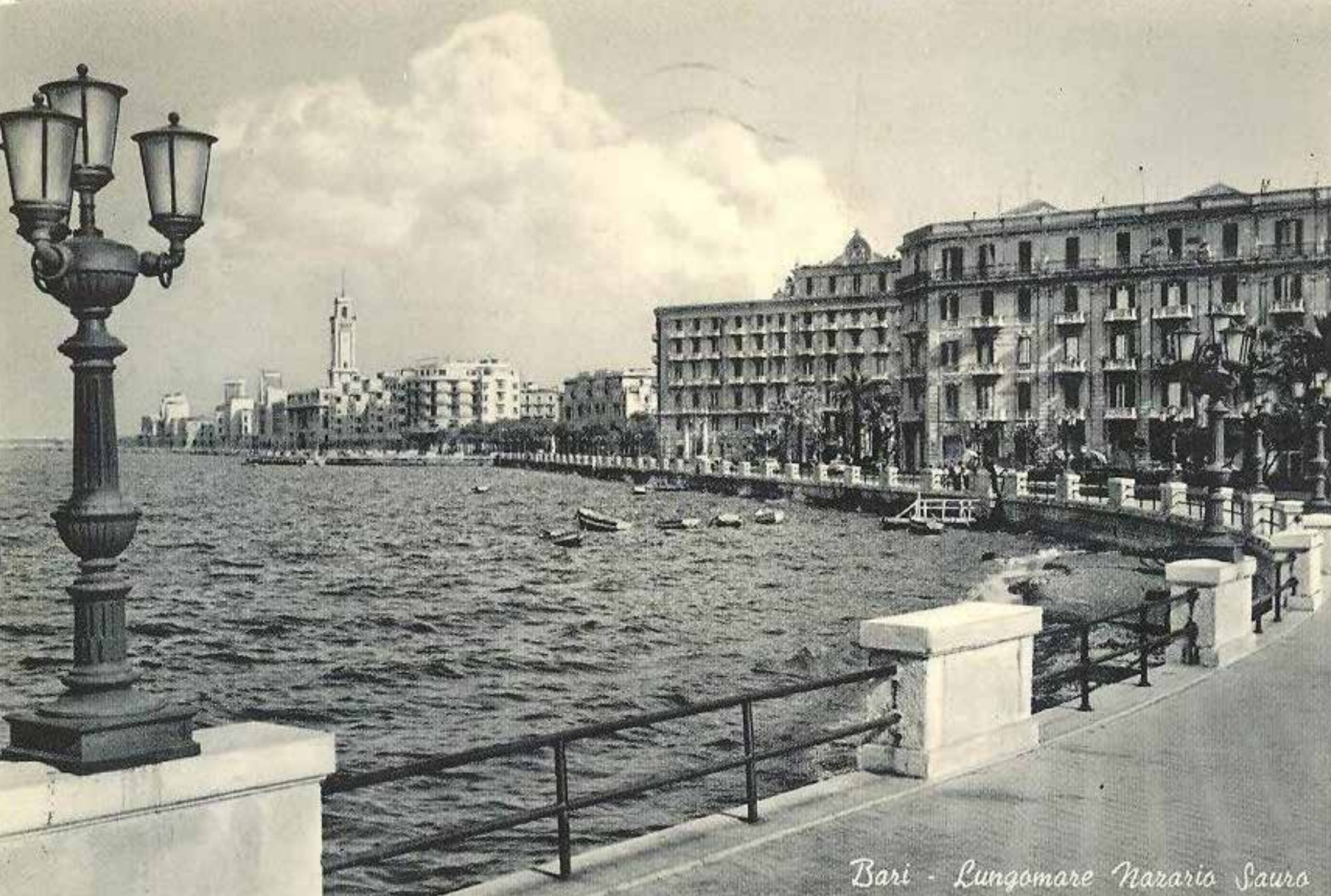
Bari - Lungomare Nazario Sauro