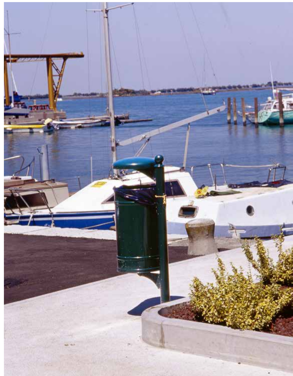
Litter bins | Street furniture