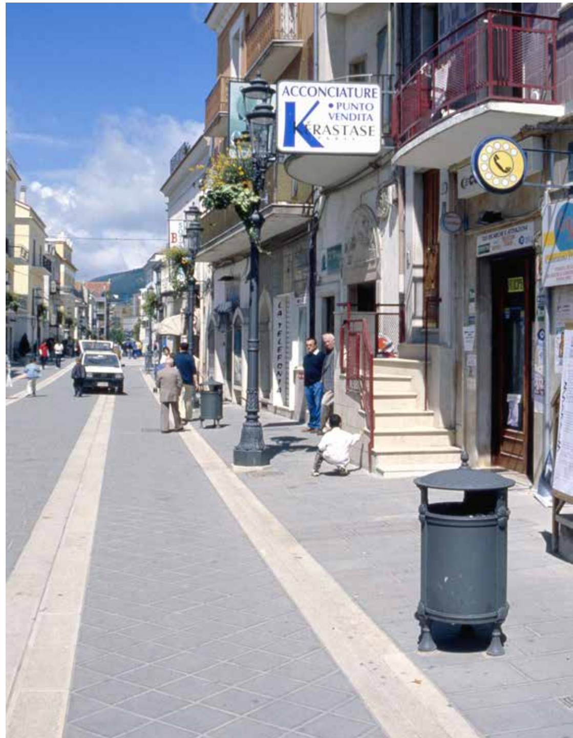
Litter bins | Street furniture