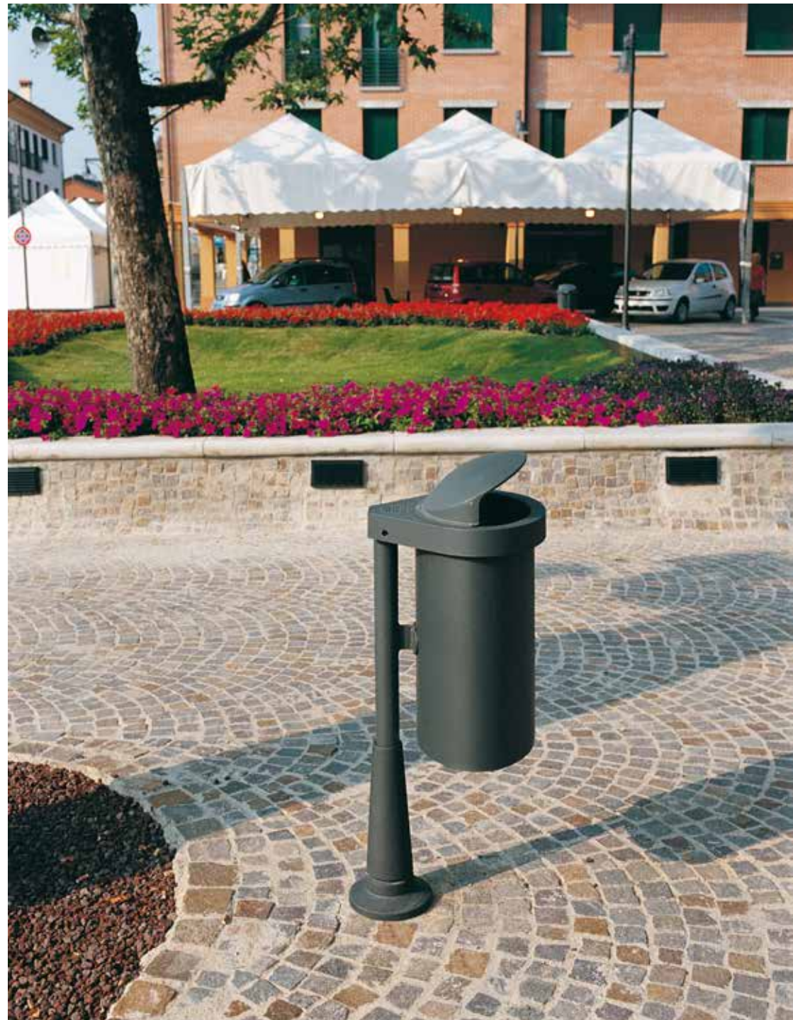
Litter bins | Street furniture